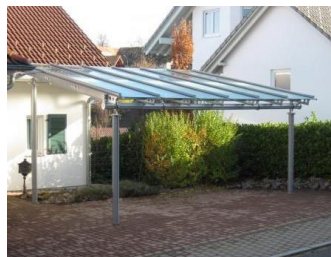
Wintergärten, Carport oder überdachte Einfahrten und Eingangsbereiche

Dach gedeckt mit Ziegeln, Metall, Dachpappe, Glas usw. bekiestes Dach begrüntes Dach