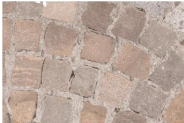
Natursteinpflaster in Beton