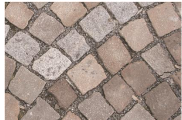
Natursteinpflaster in Kies