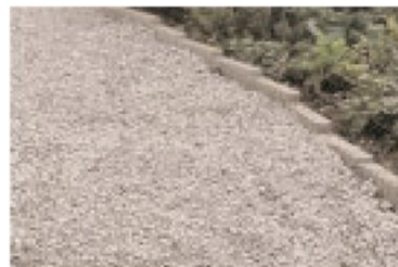
Abbildung 10: Schotter