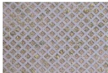
Abbildung 6: Rasengittersteine