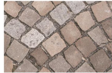
Abbildung 6: Natursteinpflaster in Kies