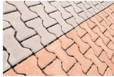
Abbildung 4: Fugenpflaster