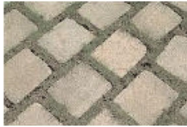
Abbildung 4: Rasenfugenpflaster