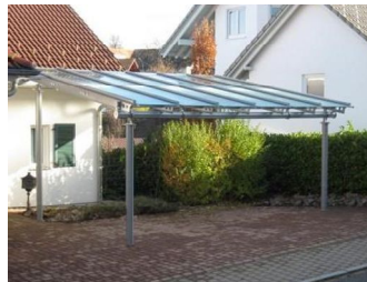
Wintergärten, Carport oder überdachte Einfahrten und Eingangsbereiche

Dach gedeckt mit Ziegeln, Metall, Dachpappe, Glas usw. bekiestes Dach begrüntes Dach