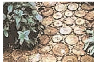
Abbildung 5: Holzpfaster