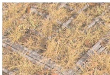
Abbildung 7: Rasenwaben