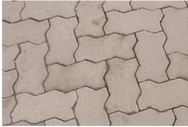
Abbildung 1: Verbundsteine