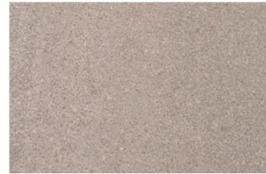
Abbildung 3: Asphalt